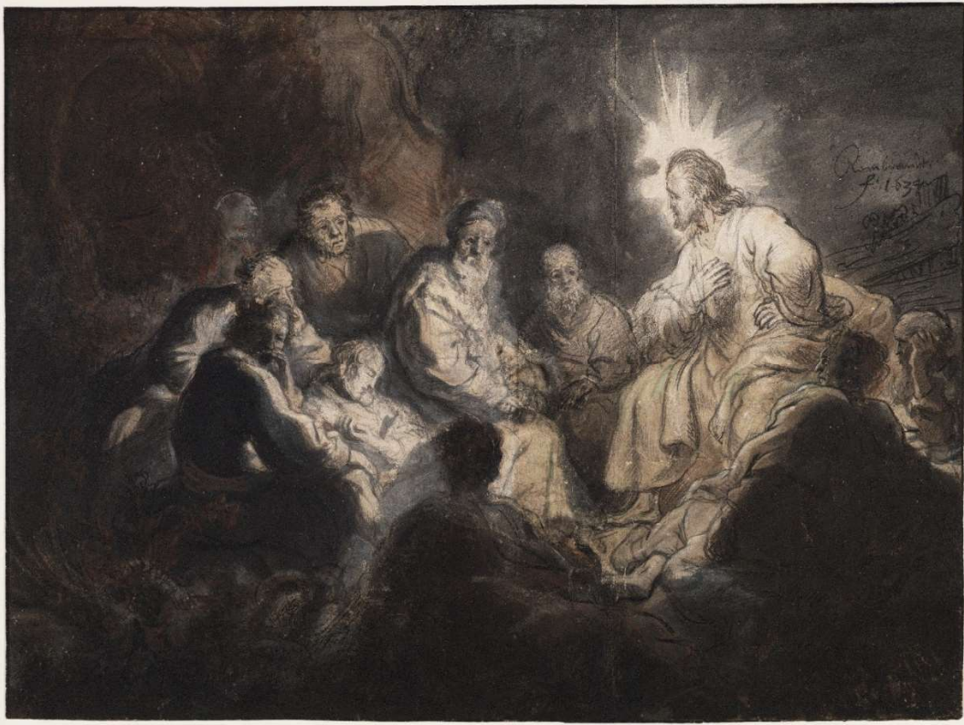
Rembrandt van Rijn, Gesù e i suoi discepoli, 1634.