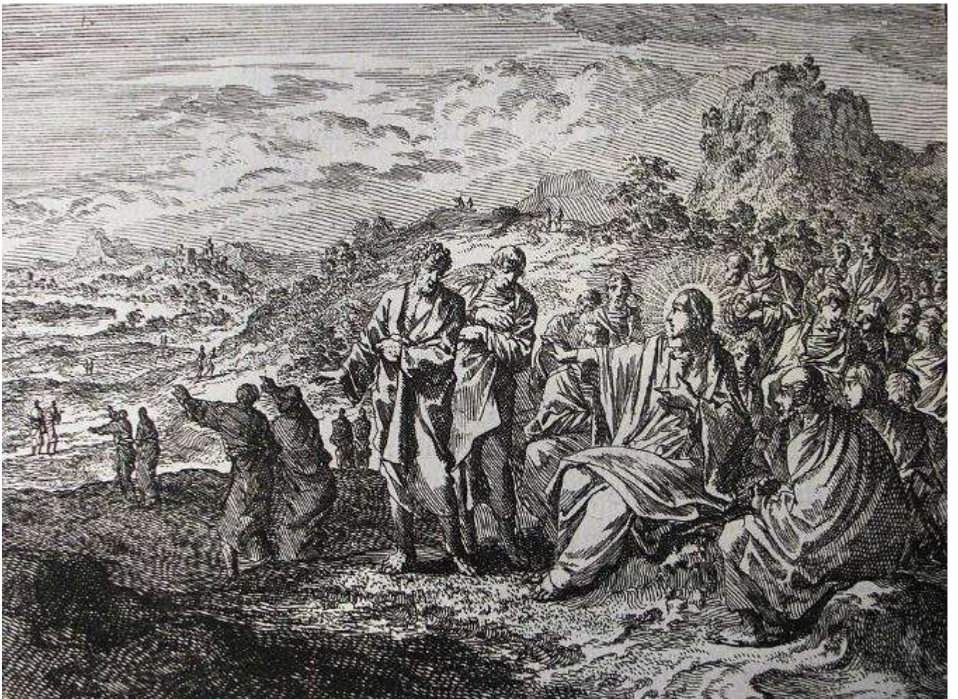
Jan Lyuken, L'invio degli Apostoli, XVII sec.