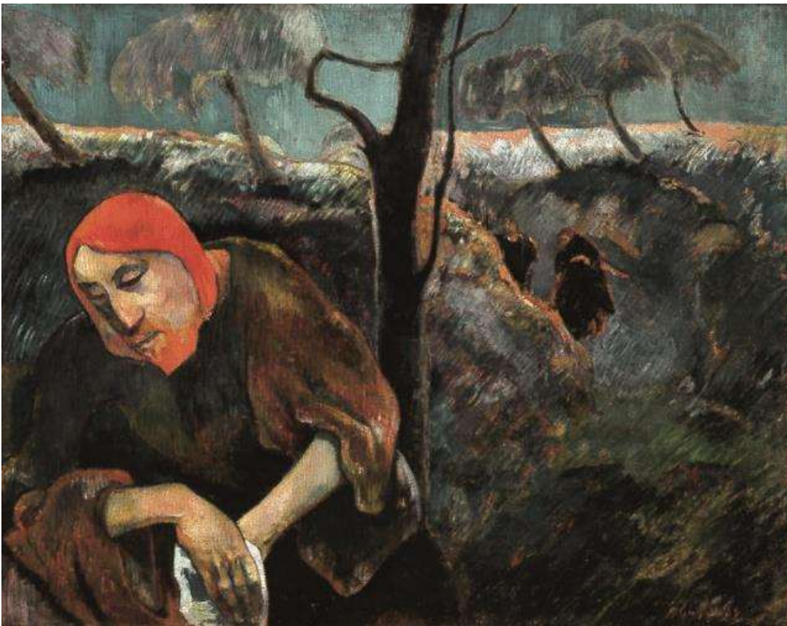
Paul Gauguin, Cristo nel Giardino degli Ulivi, 1889.