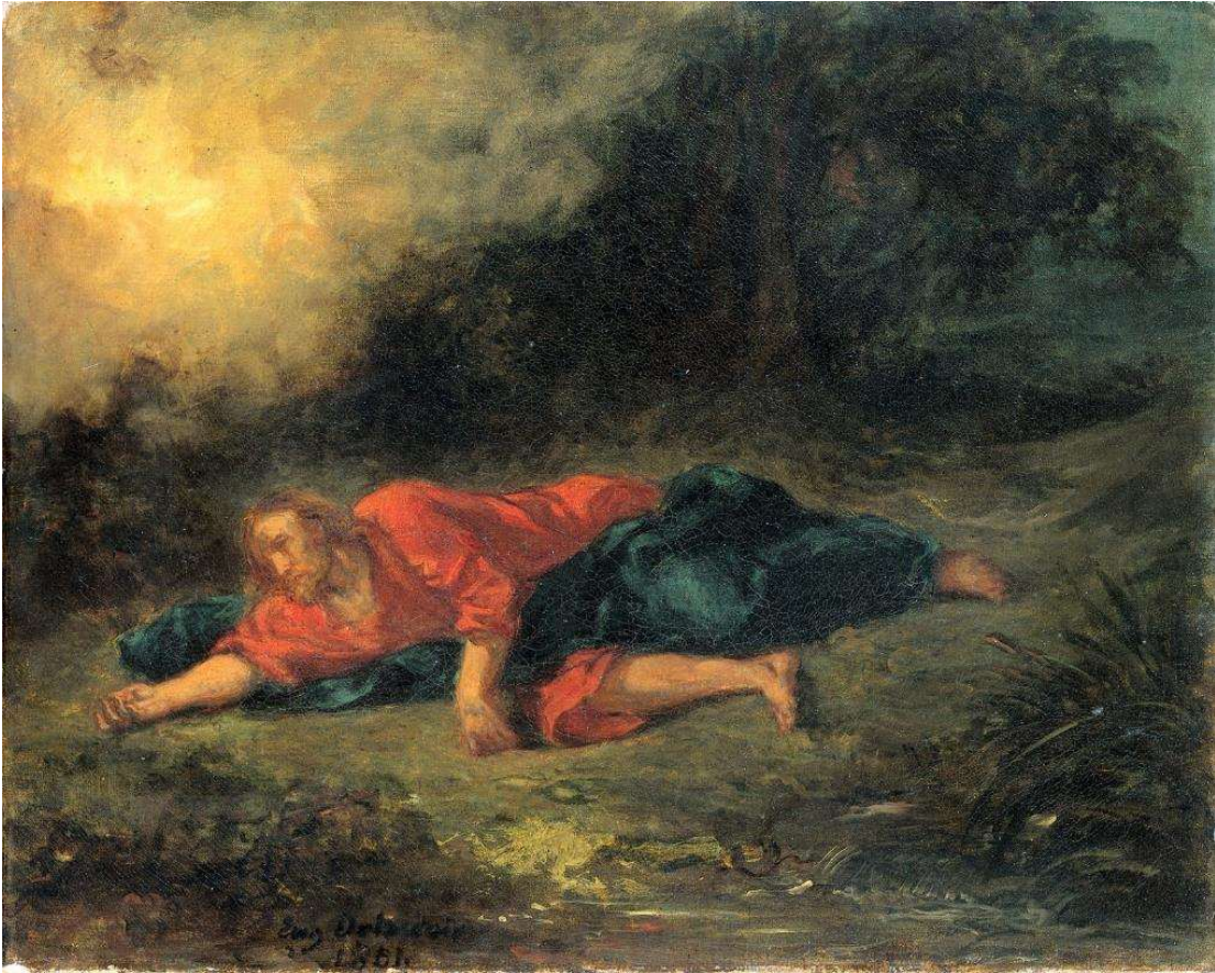
Eugène Delacroix, L'agonia nel giardino, 1861.