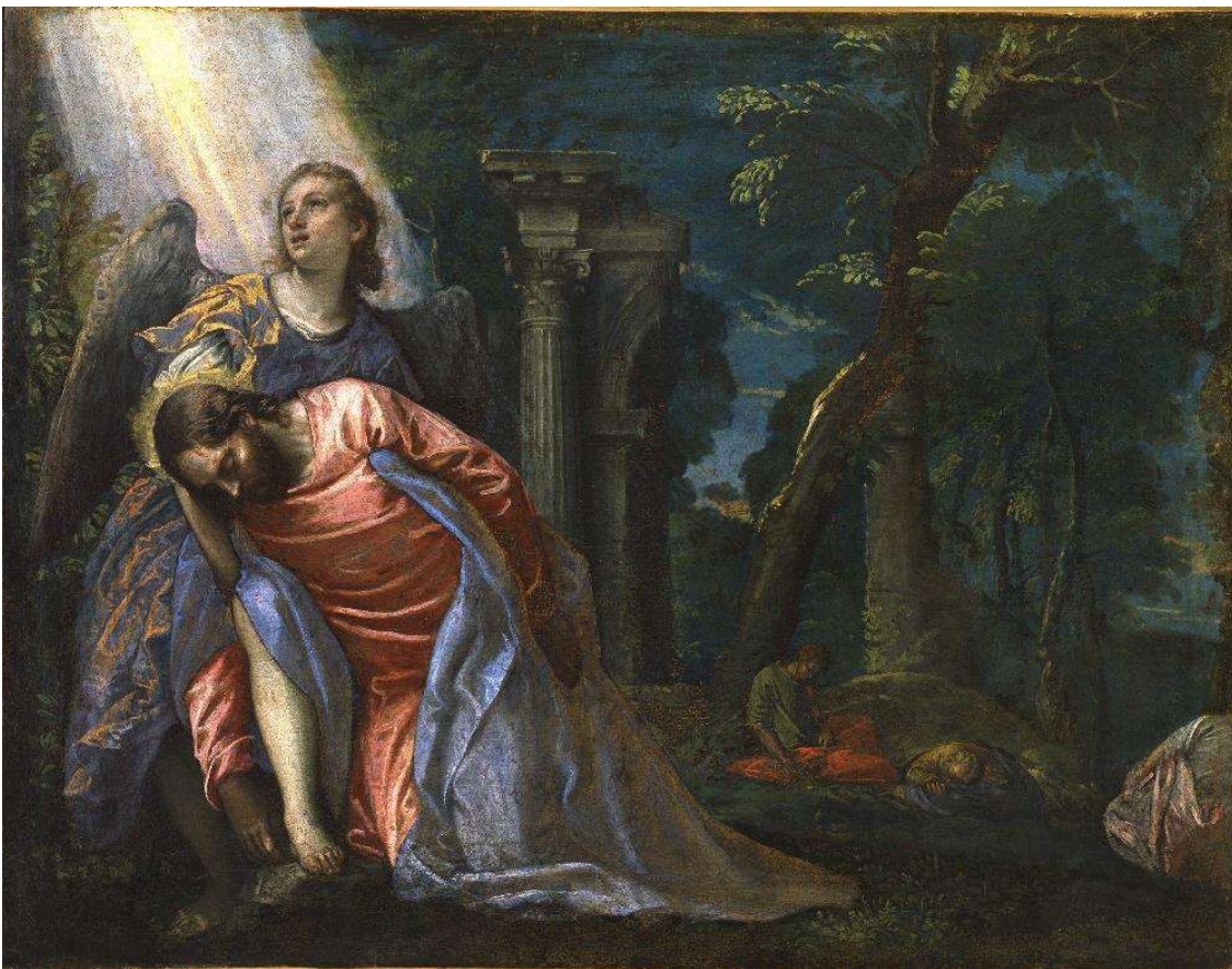
Paolo Veronese, Cristo nell'orto del Getsemani, 1583-84.