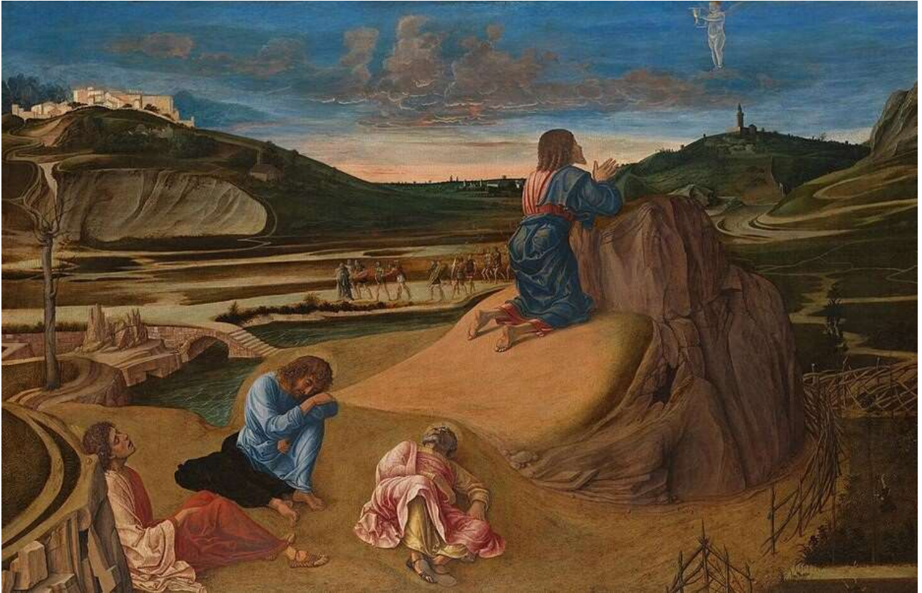
Giovanni Bellini, Orazione nell'orto, 1459 circa.