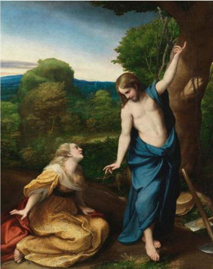
Correggio, Noli me tangere 1525, Museo del Prado, Madrid