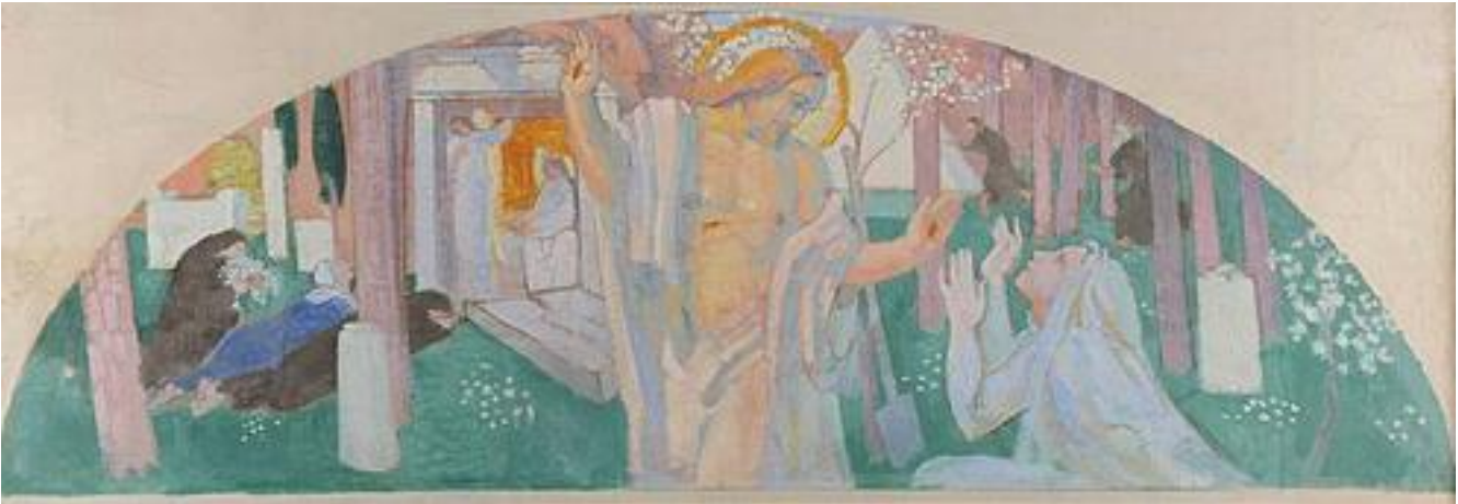
Maurice Denis, Noli me tangere 1920, Musée des Reims, Reims, Francia