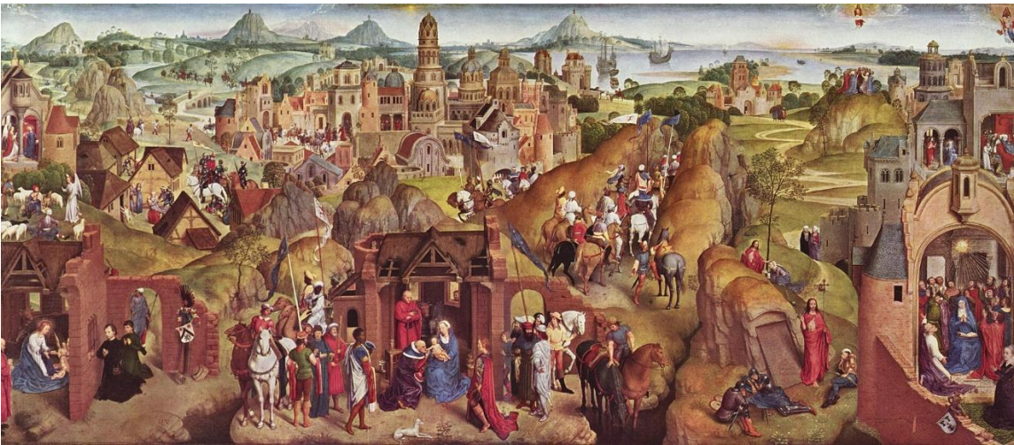
Hans Memling, Avvento e trionfo di Cristo, 1480, Monaco di Baviera