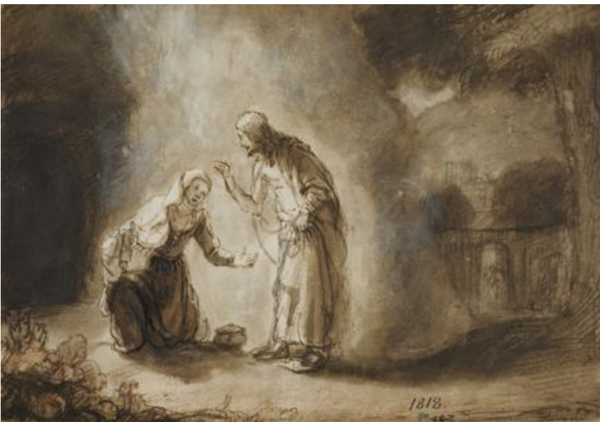
Abraham Van Dijck, Noli me tangere 1650, Nationalmuseum, Stoccolma