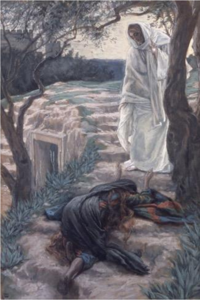
James Tissot, Noli me tangere , 1886-1894, Brooklyn Museum, New York