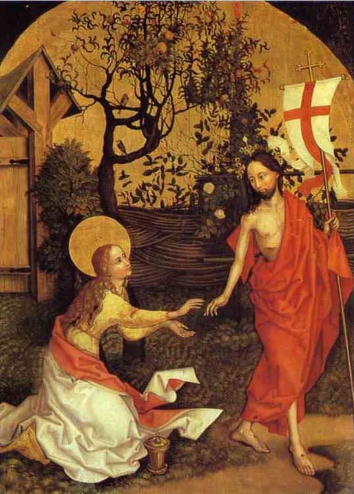
Martin Schongauer, Noli me tangere , 1472.