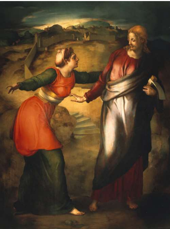
Pontormo (?), Noli me tangere , da un cartone perduto di Michelangelo Buonarroti, 1531-1532.