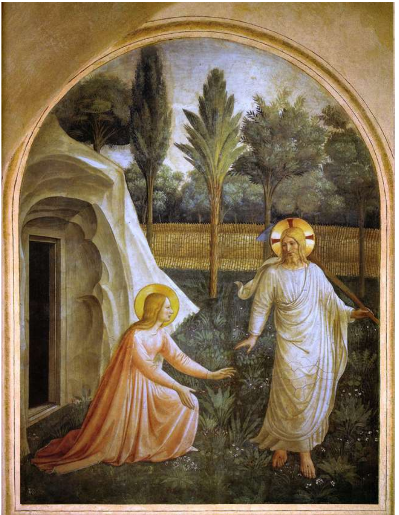
Beato Angelico, Noli me tangere, 1438-1440.