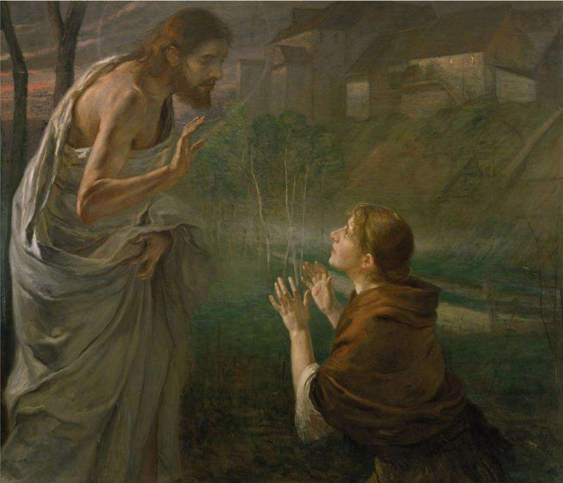
Fritz von Uhde, Noli me tangere , 1894.