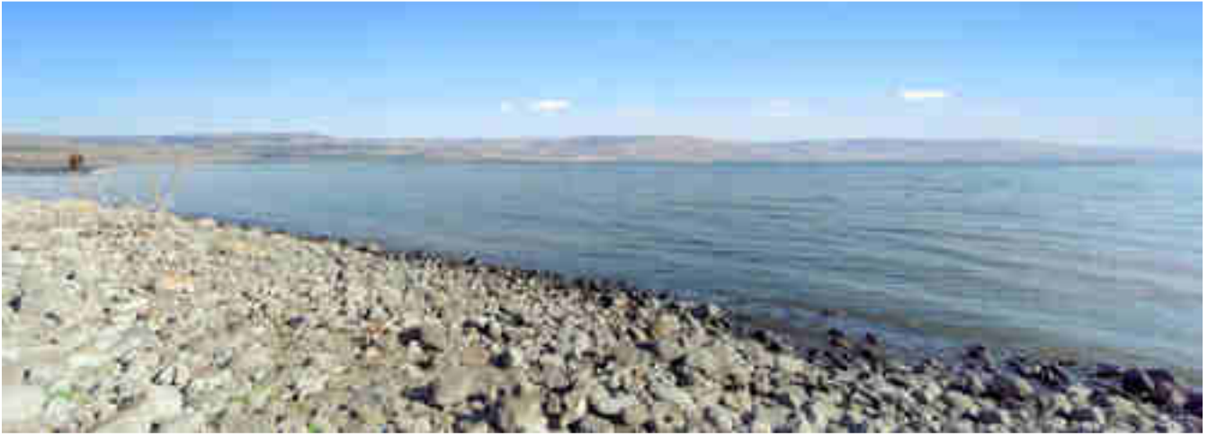
Il lago di Gennèzaret dalla spiaggia di Cafarnao