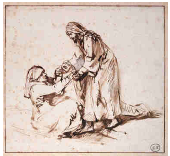
Rembrandt, Guarigione della suocera di Pietro, 1650