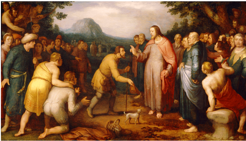
Cornelis van Haarlem, 1619