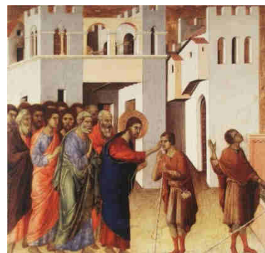
Duccio da Boninsegna, 1308