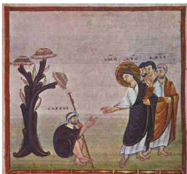
Ruodprecht, Salterio di Egbert , 980 ca.