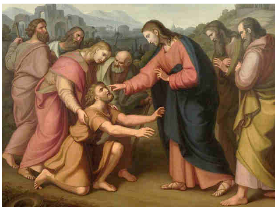
Václav Mánes, 1832