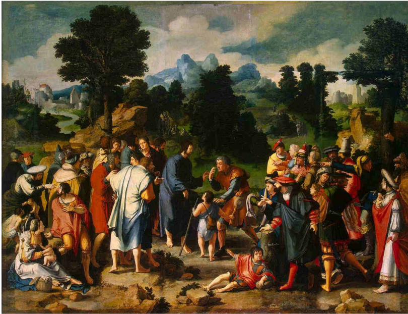
Lucas van Leyden, 1531