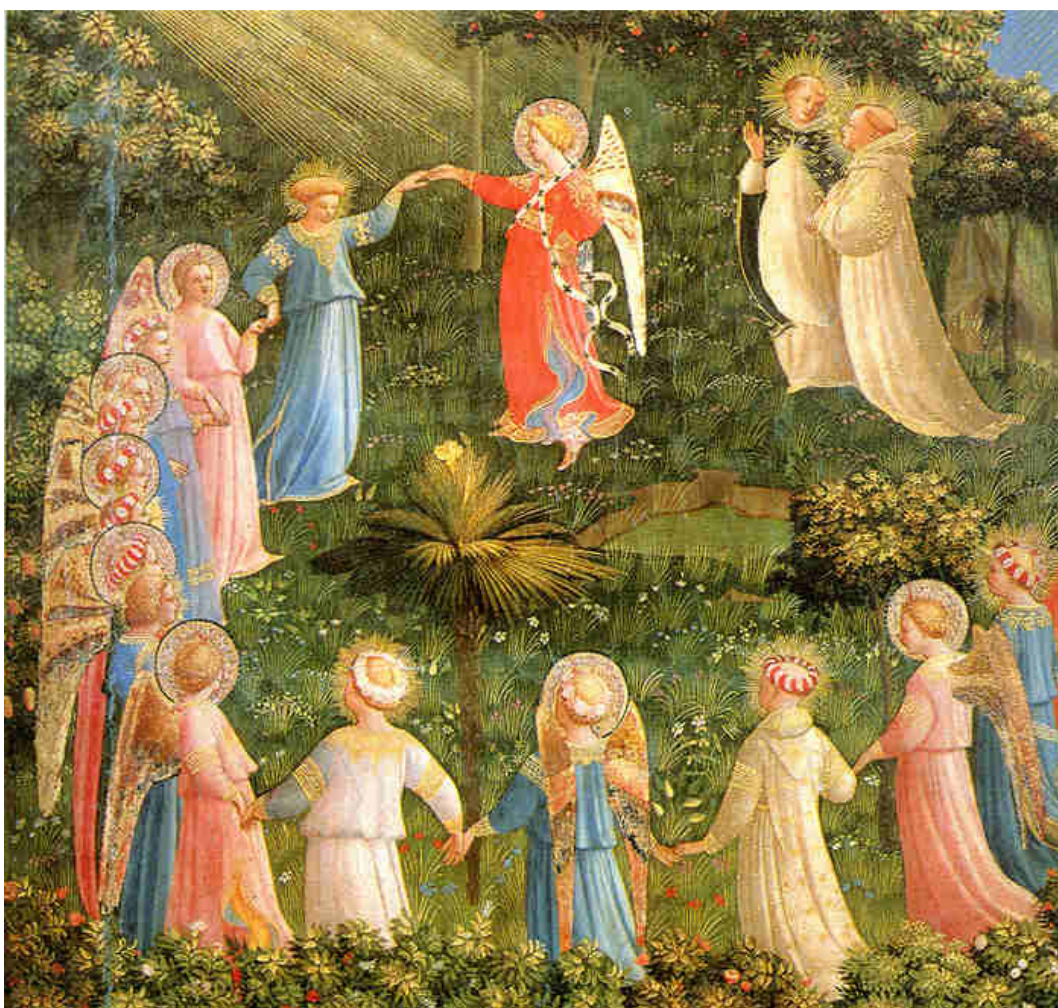
Beato Angelico, Giudizio universale, 1425-1430. Particolare.

2. Tutti: scelgo tra i brani biblici della Liturgia del tempo di Natale i brani più adatti a essere pregati con il metodo della contemplazione immaginativa e dedico loro quanto più tempo di preghiera possibile. I testi che eventualmente scriverò non verranno condivisi.