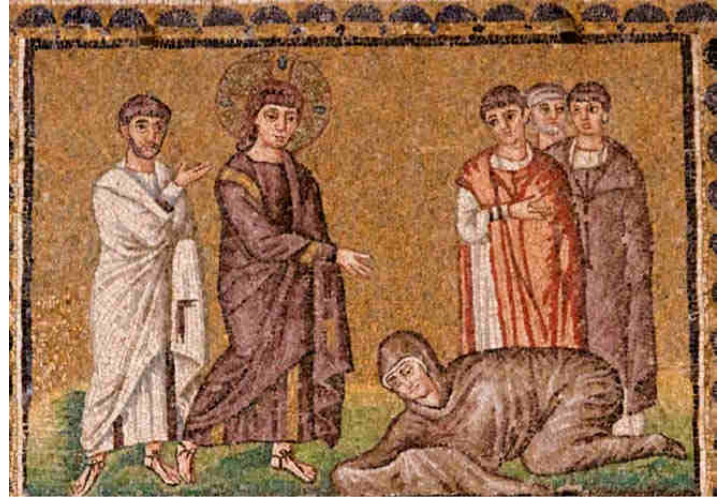
Basilica di Sant'Apollinare Nuovo, Ravenna, VI secolo.