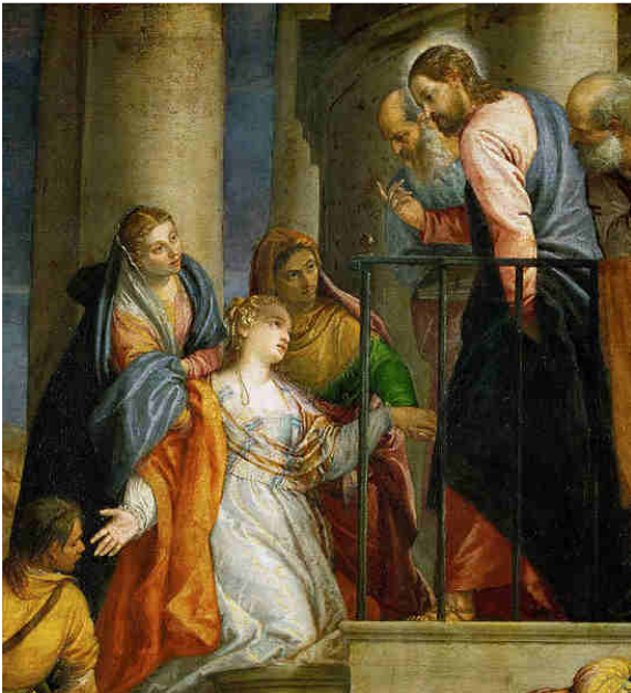
Paolo Veronese, 1570 circa. Particolare.