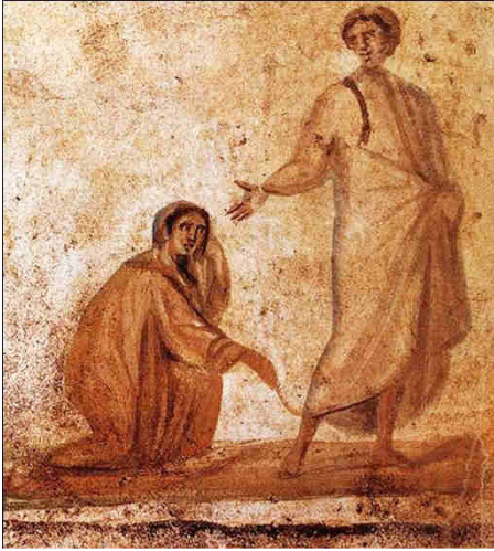
Catacombe dei santi Marcellino e Pietro, Roma, III-IV secolo.