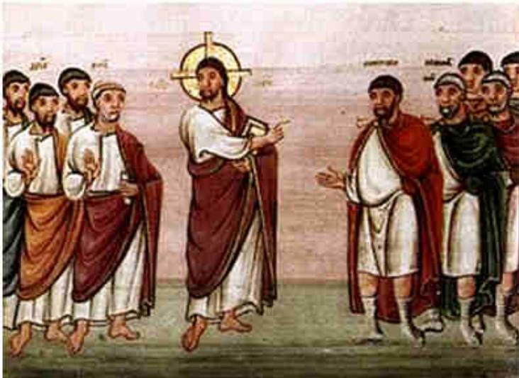
Codex Egberti, fol. 22r, 977-993.