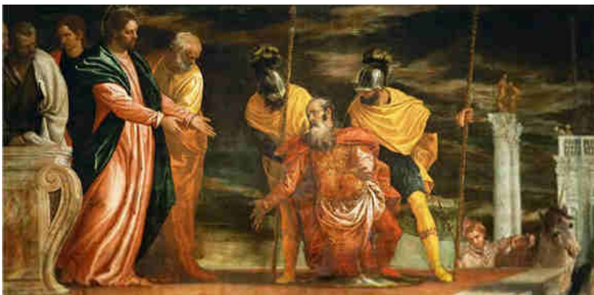
Paolo Veronese, 1571.

Il Codex Egberti è un'evangelistario, opera di miniatura ottoniana, realizzato tra il 980 e il 993 nello Scriptorium dell'Abbazia di Reichenau su richiesta dell'arcivescovo di Treviri Egberto. È la più antica rappresentazione grafica del ciclo della vita di Cristo a noi pervenuta.