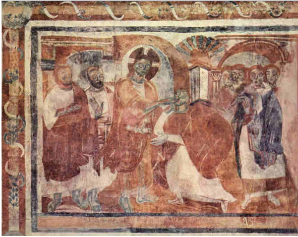
Monastero di San Giovanni, Müstair, Svizzera, 830 ca.