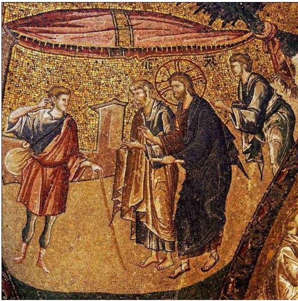
Chiesa di San Salvatore in Chora, museo Kariye, 1315.