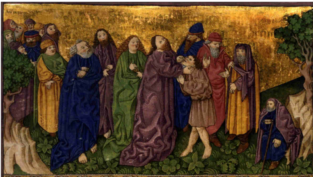
Bibbia di Ottheinrich Folio 055v Mc7C, 1430 circa