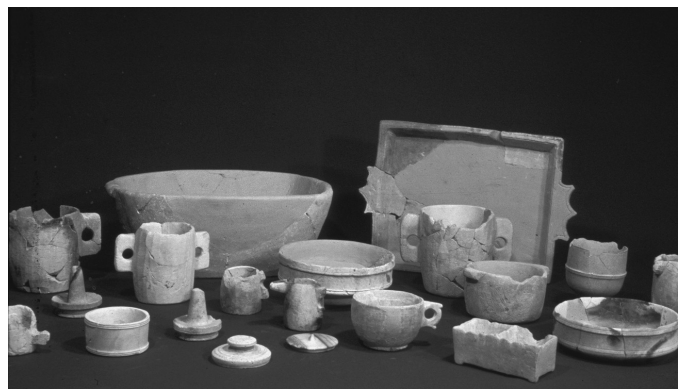
Recipienti e calici rituali, Israele, I secolo 1