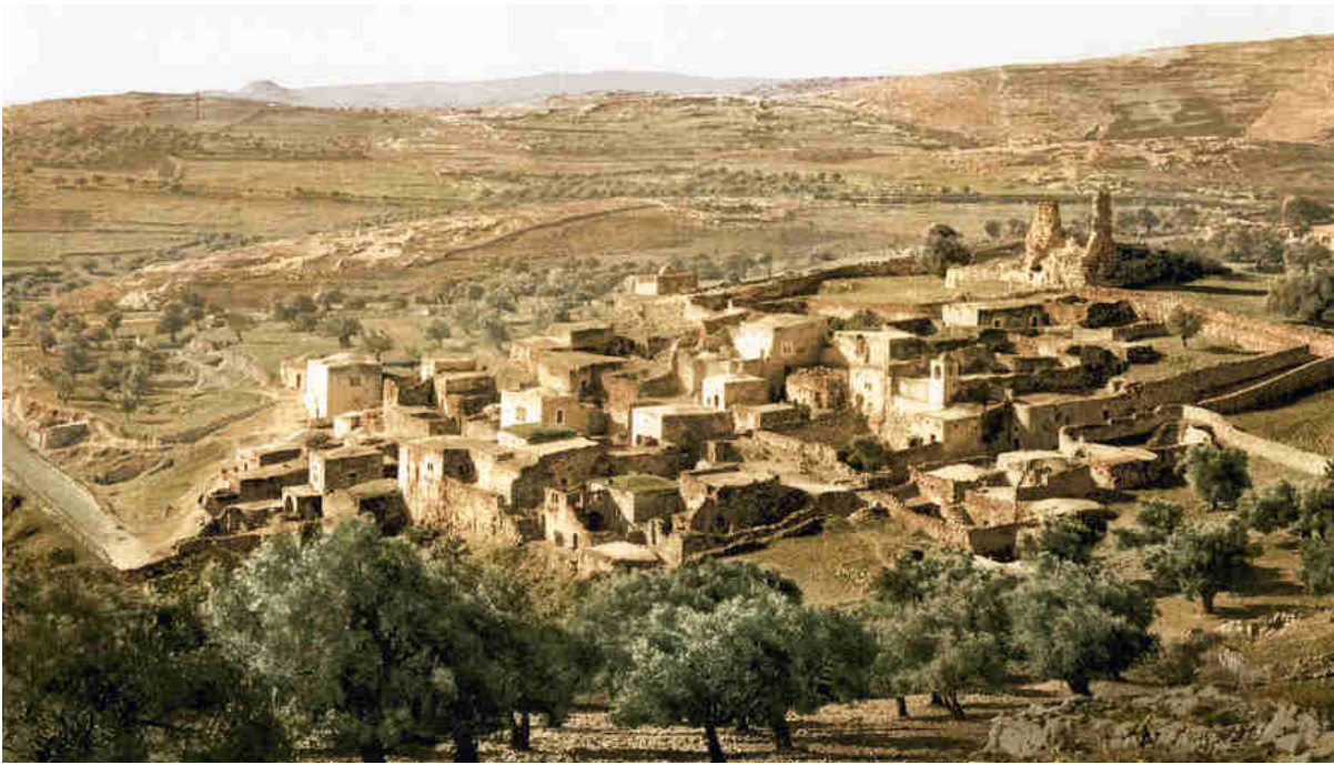
Betania, inizio 1900.