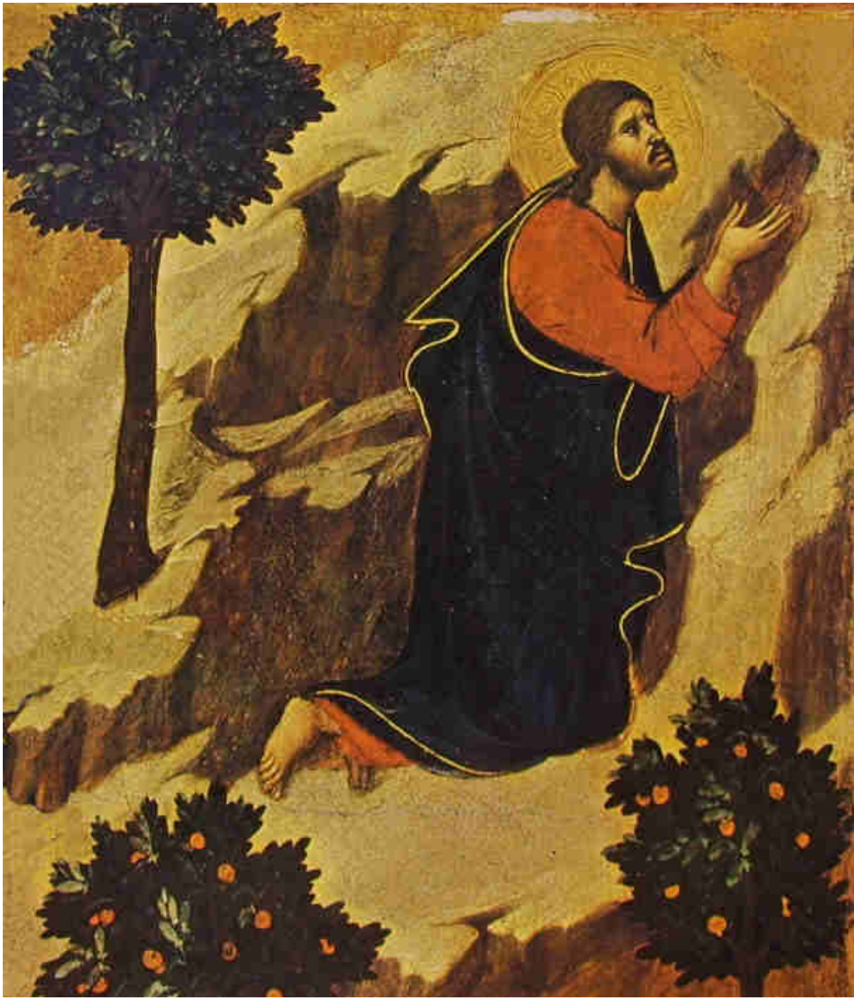
D'après Duccio di Buoninsegna, Preghiera nel Getsemani, 1308-1311.