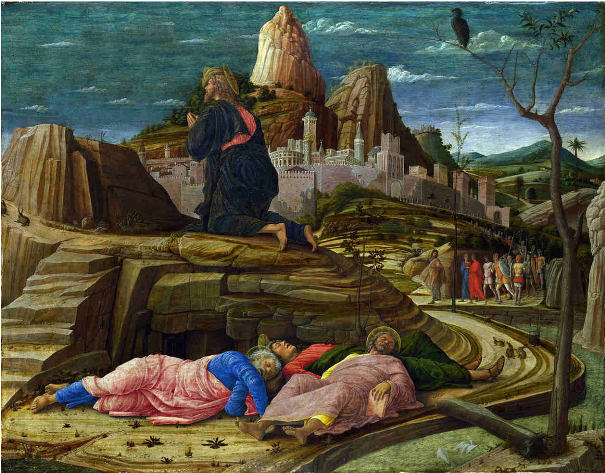
D'après Andrea Mantegna, Orazione nell'orto, 1455 circa.