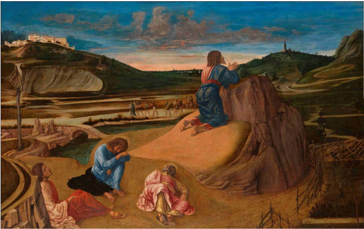
D'après Giovanni Bellini, Orazione nell'orto, 1459 circa.