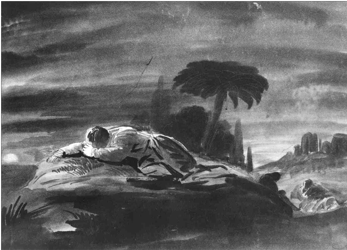
Robert Walter Weir, Christ in the Garden of Gethsemane, 1855 circa