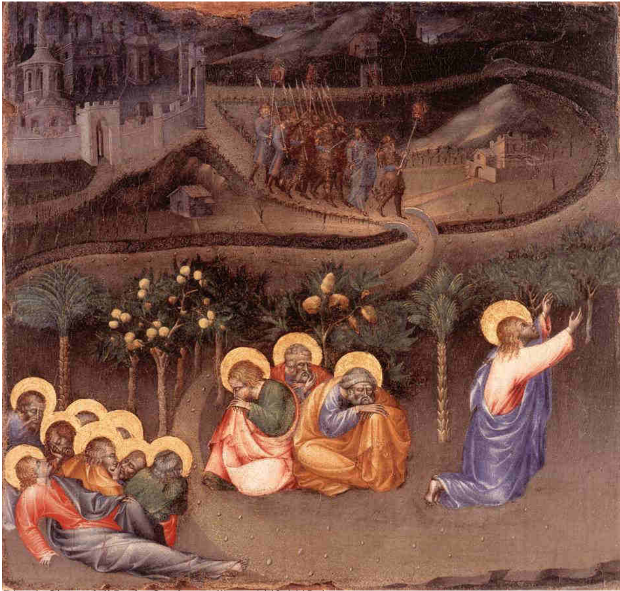
D'après Giovanni di Paolo, Orazione nell'orto, 1440-1445 circa.