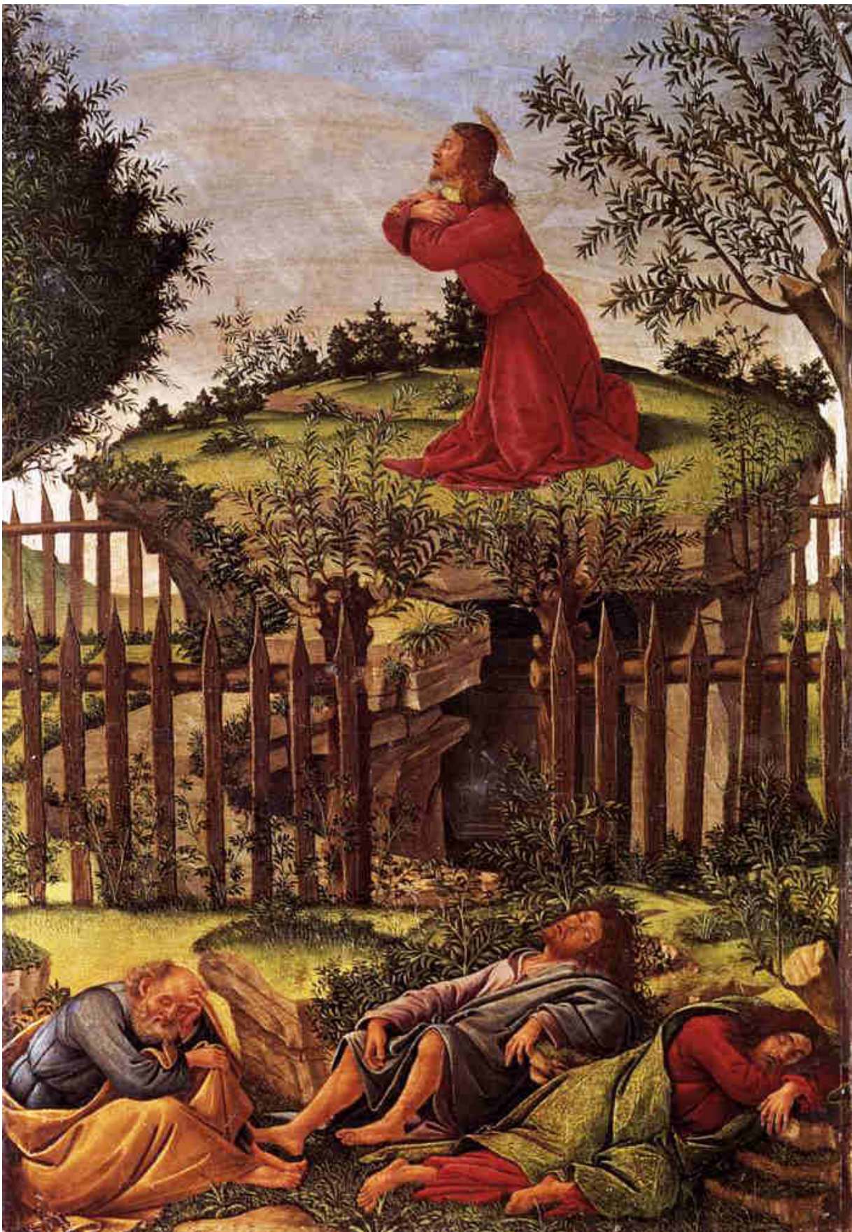
D'après Sandro Botticelli, Orazione nell'orto, 1490-1493 circa.