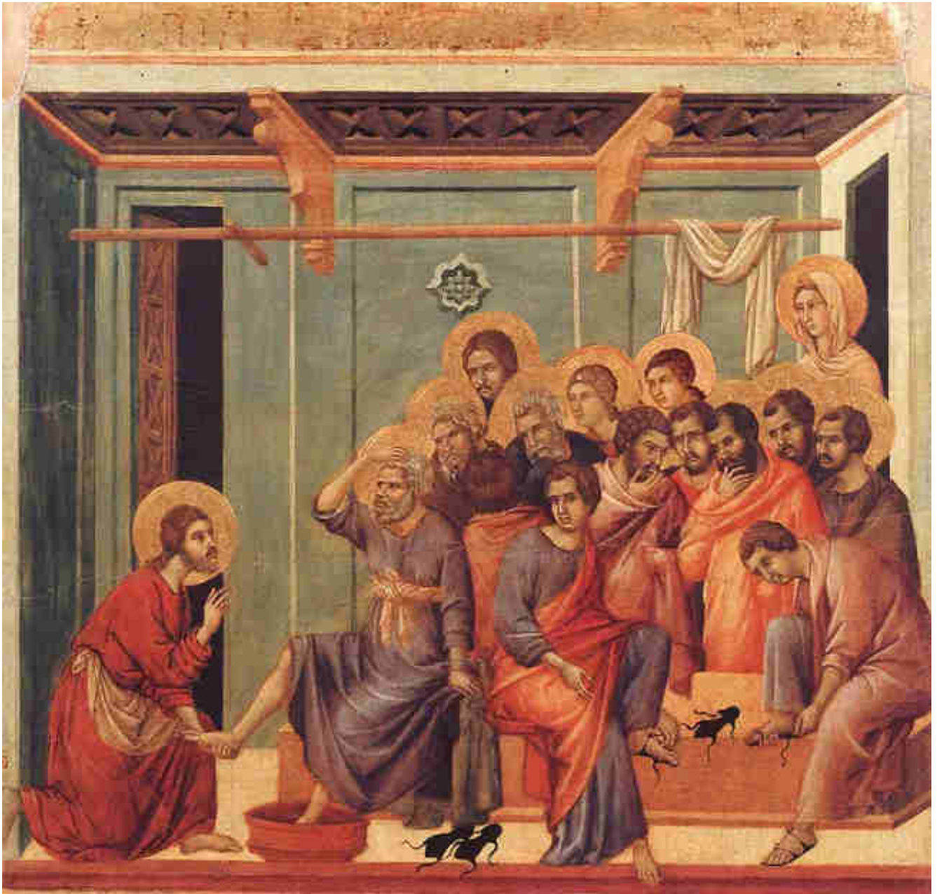
D'après Duccio di Buoninsegna, La lavanda dei piedi, Maestà , 1308-1311.