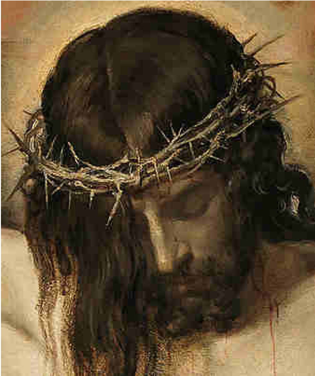
Diego Velázquez, Cristo crucificado, 1632, particolare.