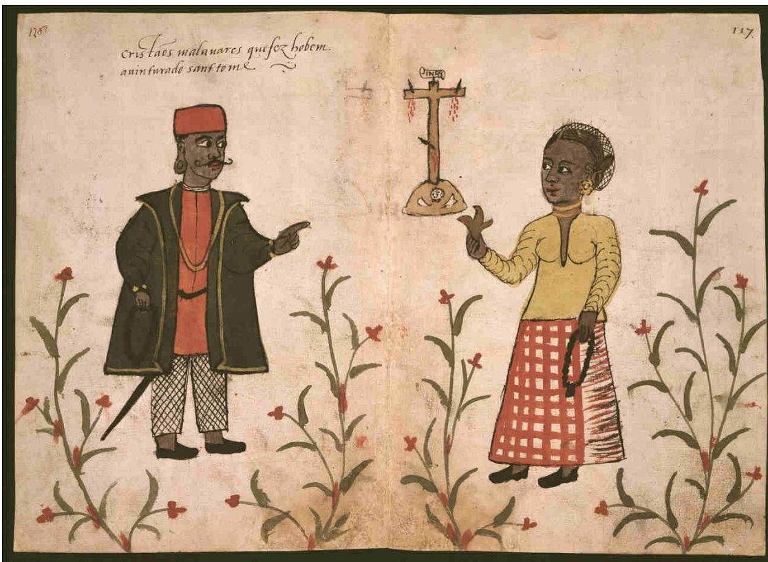
Anonimo, "Malabaresi resi cristiani dall'intraprendente San Tommaso", Album di disegni, illustranti usi e costumi dei popoli d'Asia e d'Africa con brevi dichiarazioni in lingua portoghese , XVI secolo, Biblioteca Casanatense, Roma.