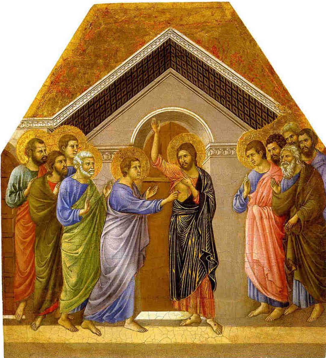
Duccio di Buoninsegna, Maestà, 1308-1311.

Un invito: Leggere l'omelia di Papa Francesco sull'apparizione ai discepoli di Emmaus (all.1) e individuare i punti che potrebbero riferirsi a specifici passaggi del metodo della contemplazione immaginativa. Chi lo desidera, può lasciare un breve messaggio in merito su whatsapp SL2.