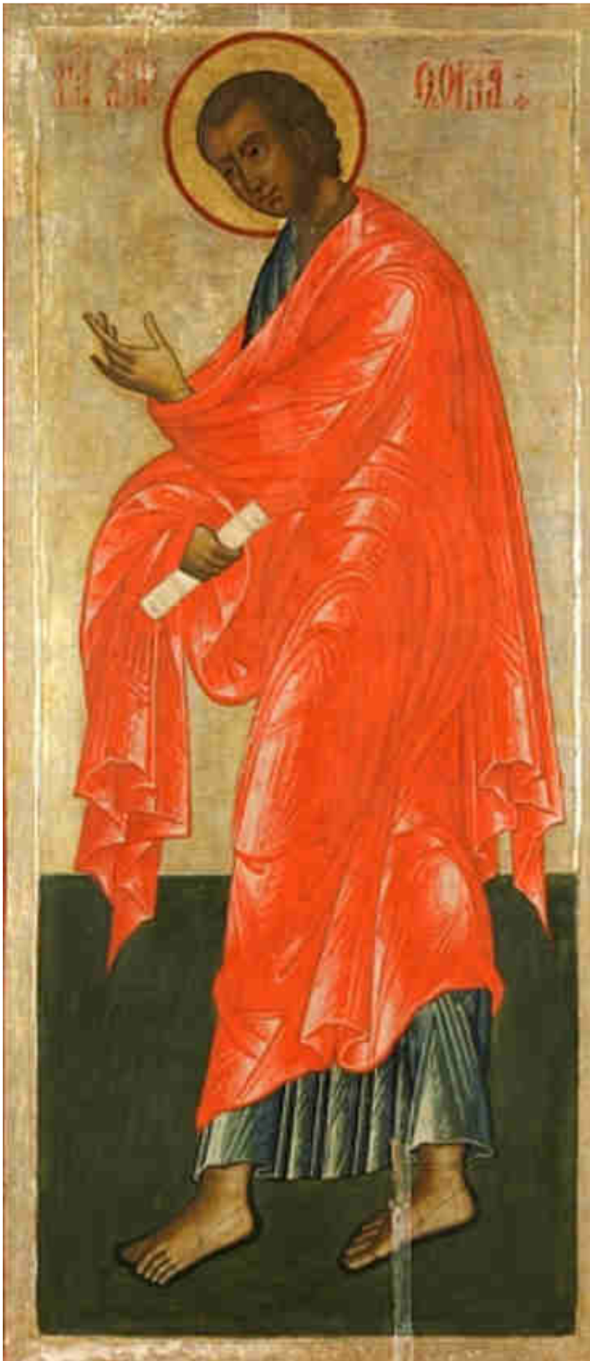
Icona bizantina di San Tommaso Apostolo.