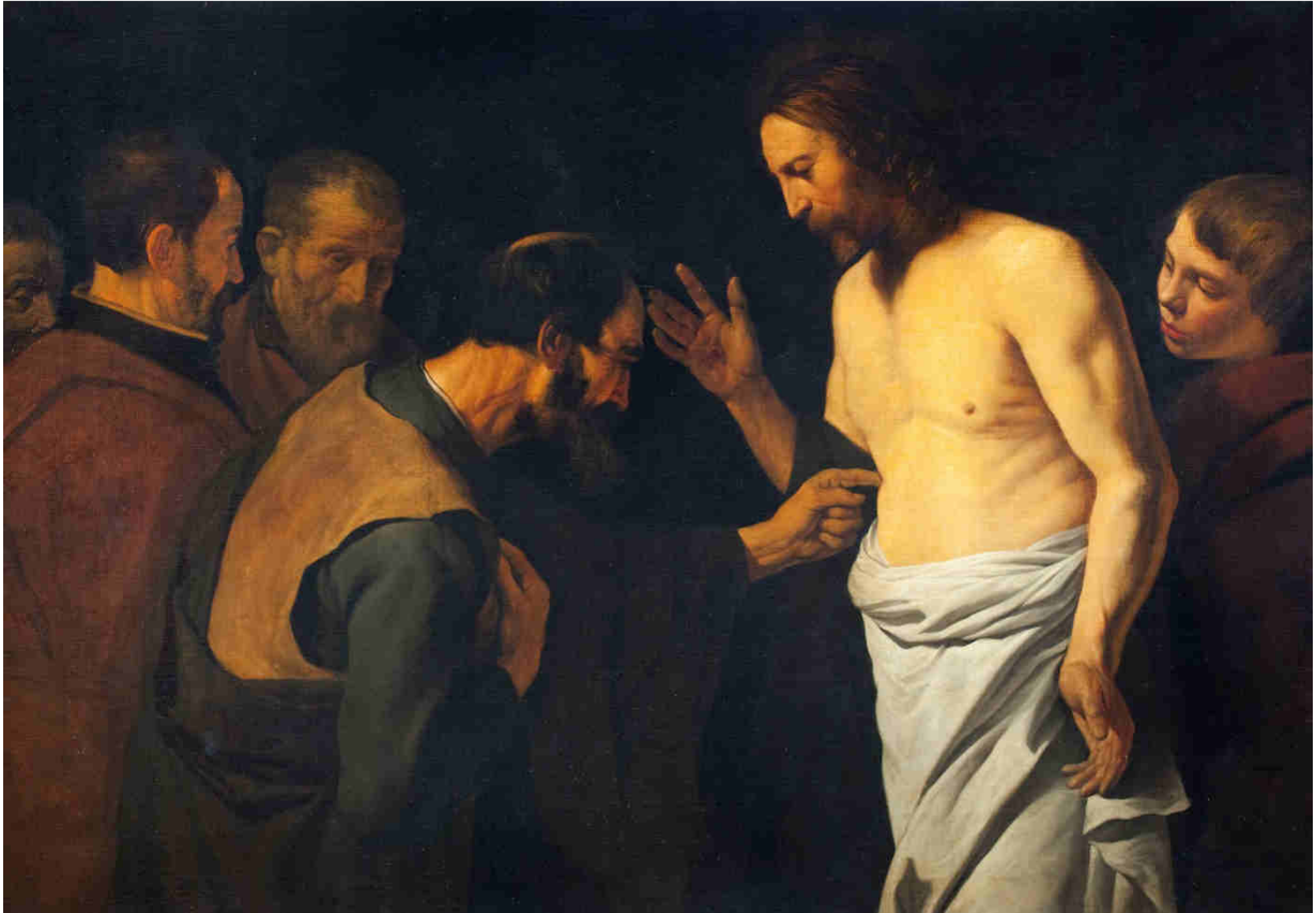
Leendert van der Cooghen, 1654.