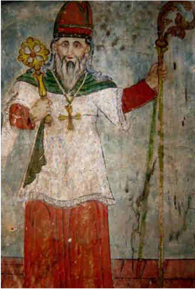
Affresco raffigurante Mar Toma (San Tommaso), 1680. Chiesa ortodossa di Santa Maria a Angamaly, Kerala, India..