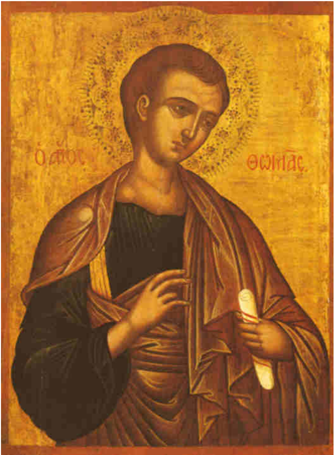
Icona di San Tommaso Apostolo, Creta, XVII secolo.