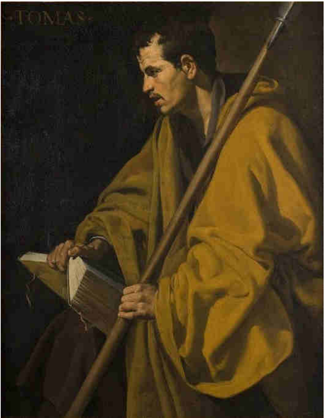
Diego Velazquez, San Tommaso Apostolo, 1620.