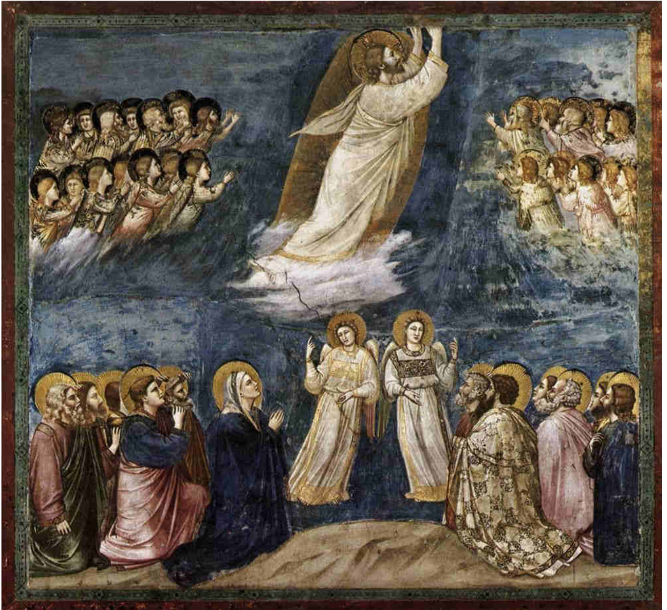
Giotto, Ascensione di Cristo, Cappella degli Scrovegni, 1305.