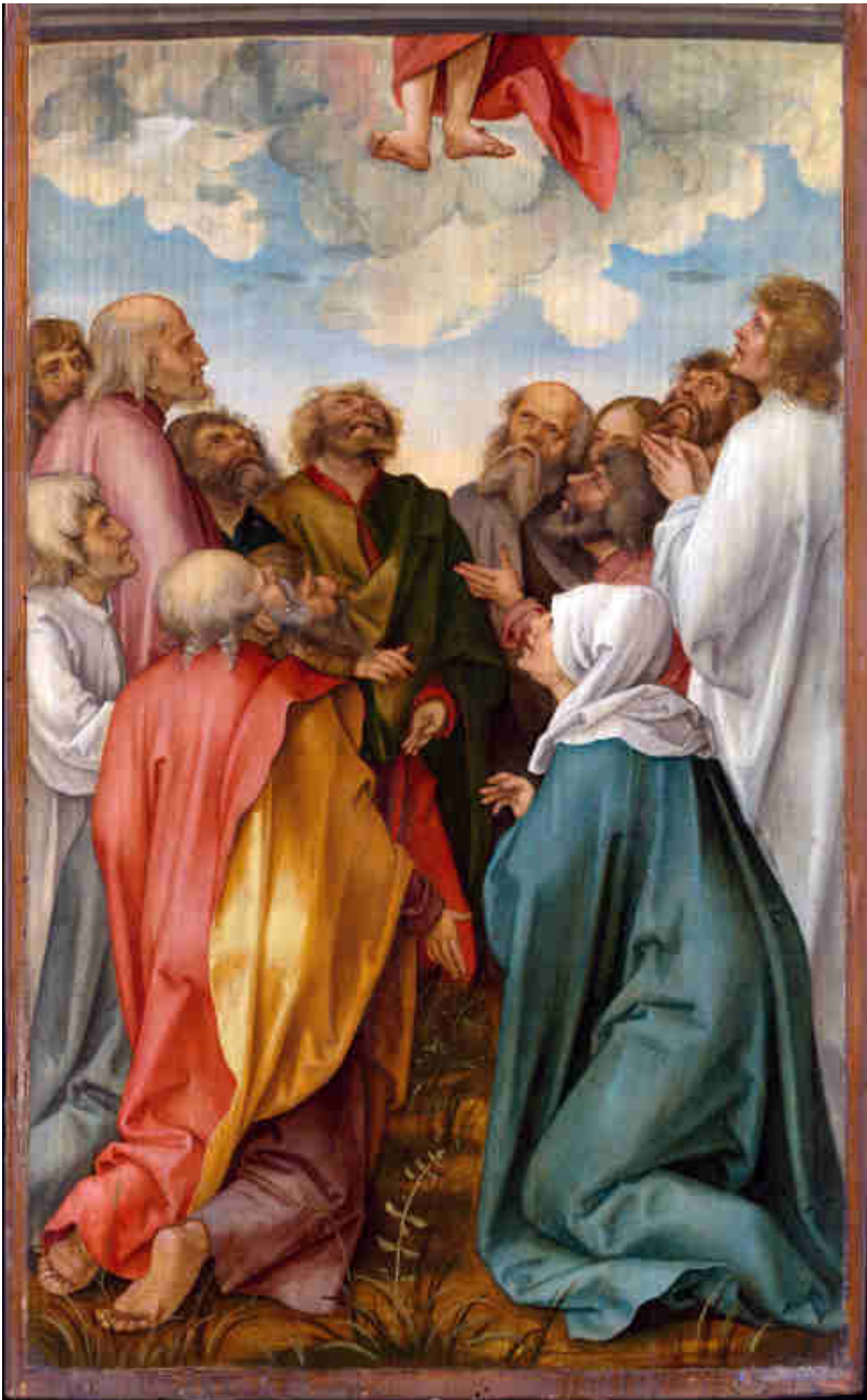
Hans Süß von Kulmbach, Ascensione di Cristo, 1513.