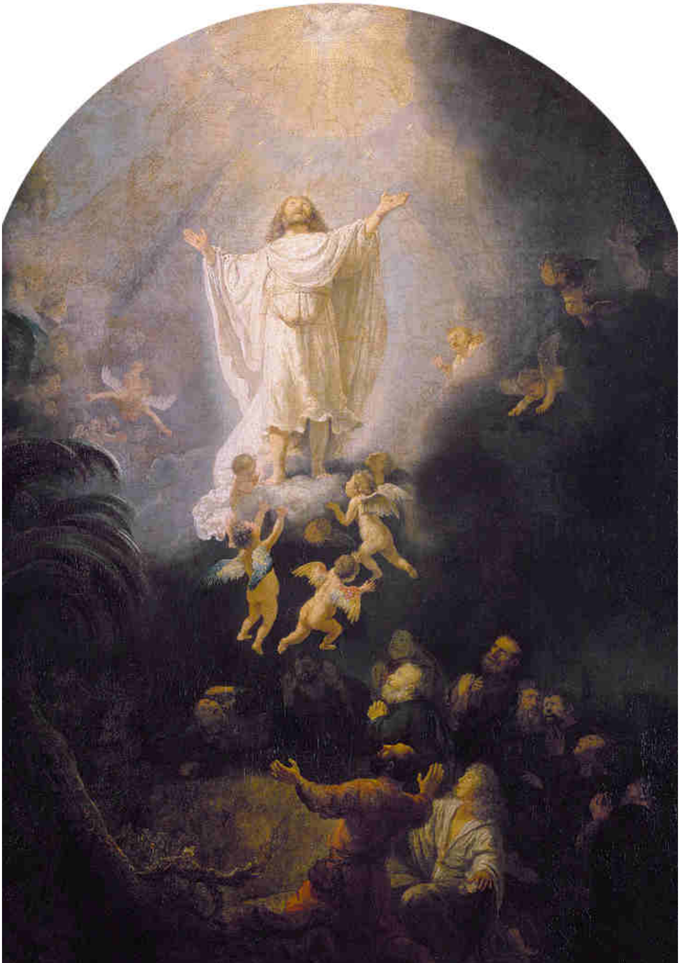
Rembrandt van Rijn, Ascensione di Cristo, 1636.