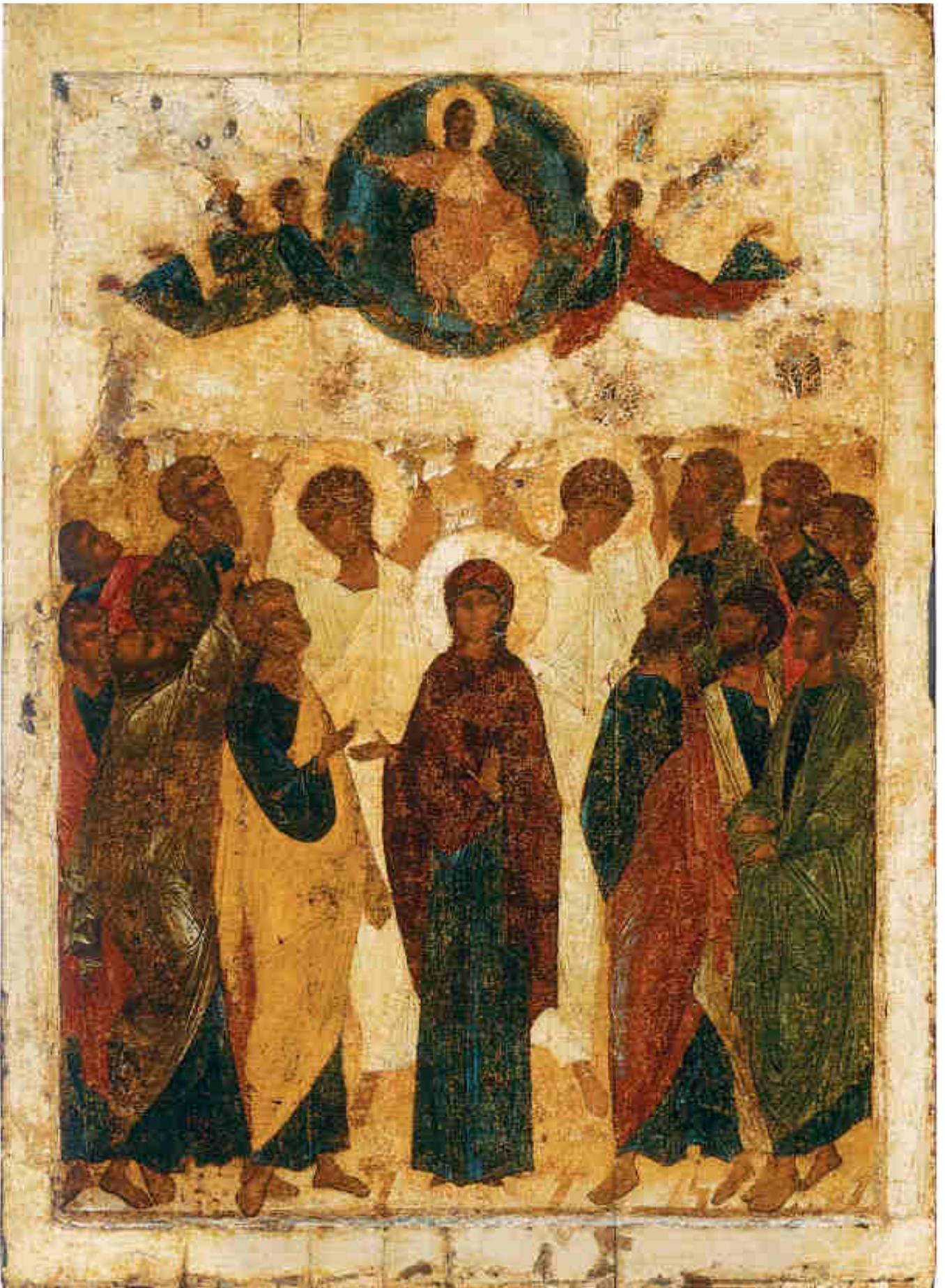
Andrei Rublev, Ascensione di Cristo, 1408.