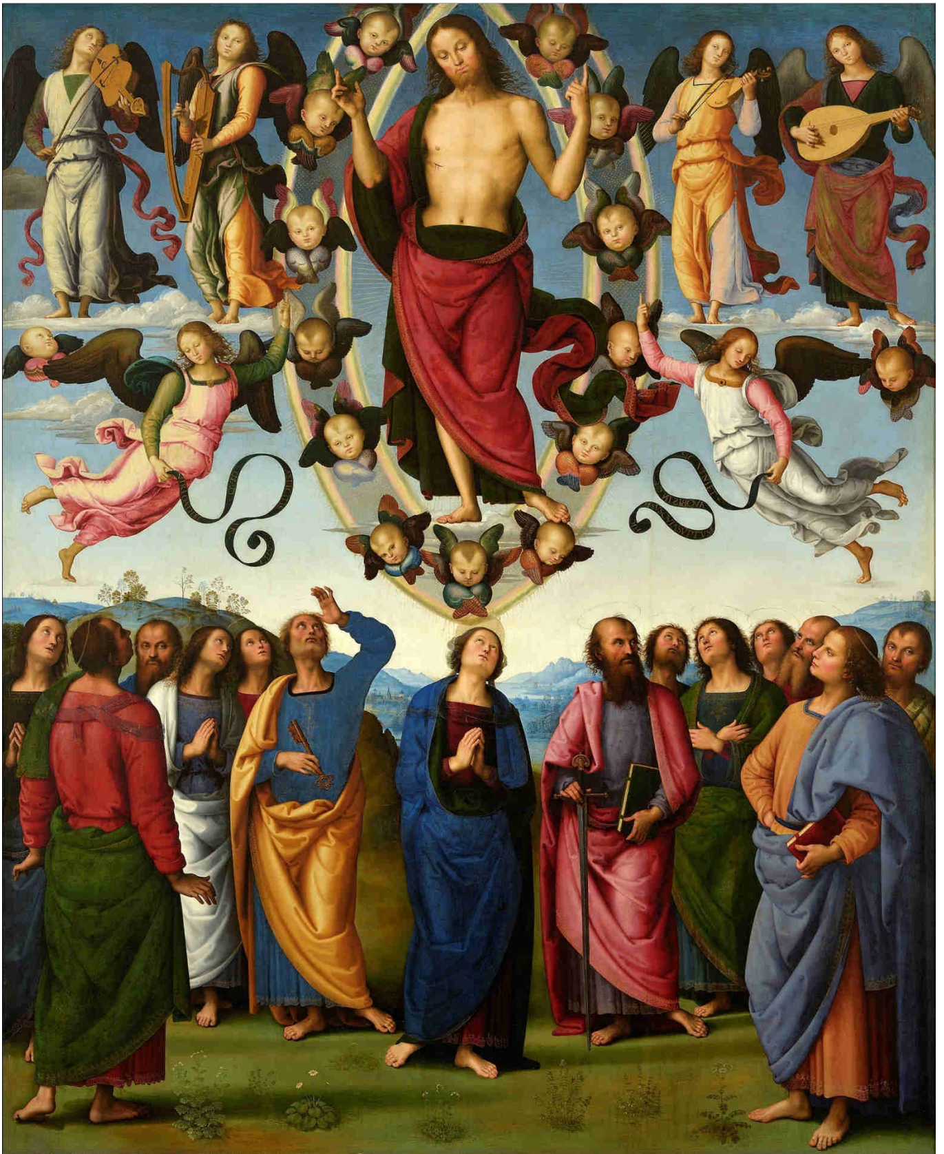
Pietro Perugino, Ascensione di Cristo, 1500.