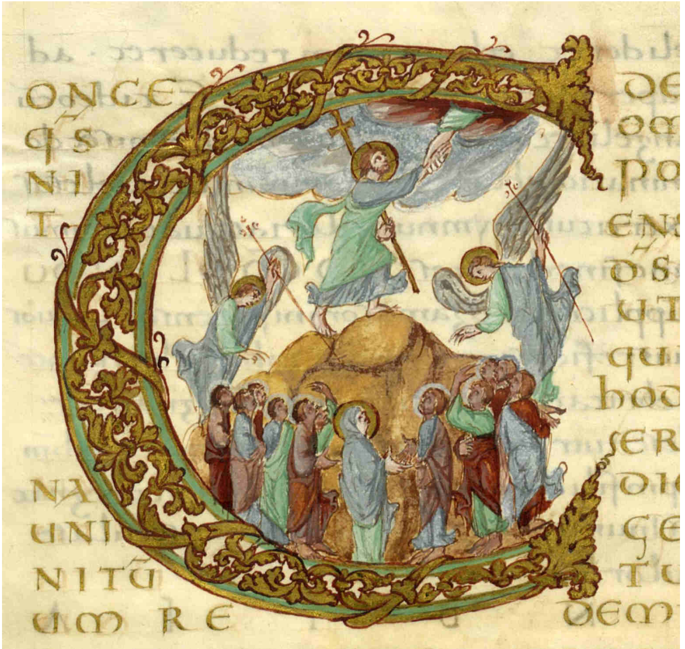
Sacramentario di Drogo, Ascensione di Gesù inscritta nella lettera C, 850 circa.