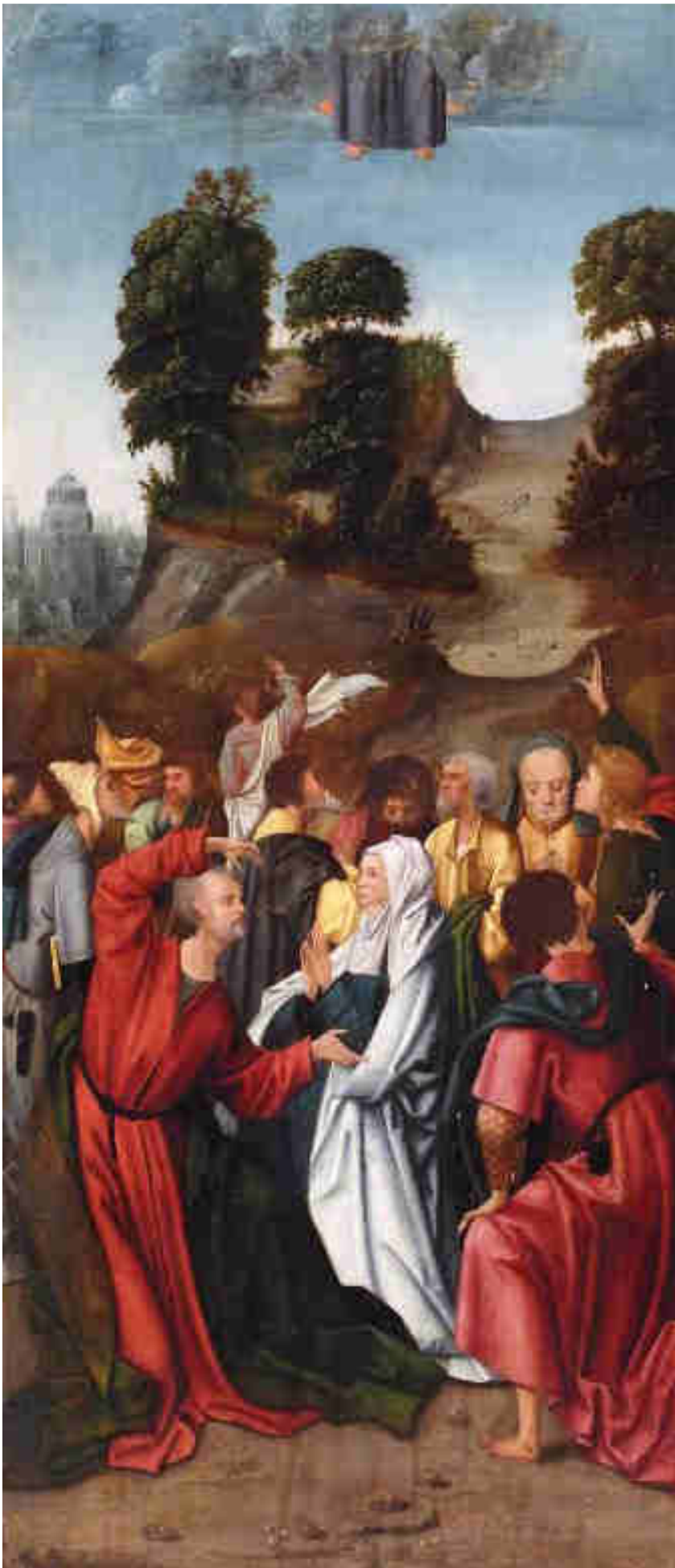
Adriaen van Overbeke, Ascensione di Cristo, 1516.