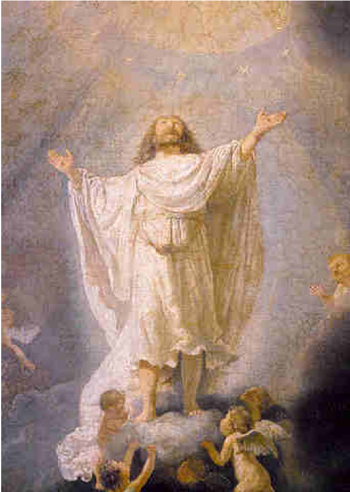
Rembrandt van Rijn, Ascensione di Cristo , 1636, particolare.

Infine, da Risen , regia di Kevin Reynolds (2015): Ascension of Jesus Christ , https://youtu.be/RD0LNtc1UE4 .