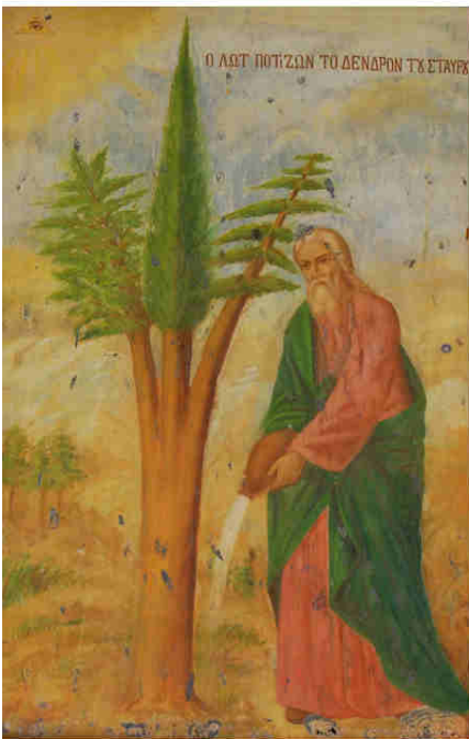
Lot innaffia l'Albero santo (cfr. Gen 19,27-38) Monastero della Santa Croce, Gerusalemme